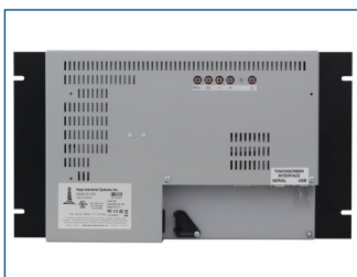
Vista trasera del monitor de montaje en bastidor de 15".