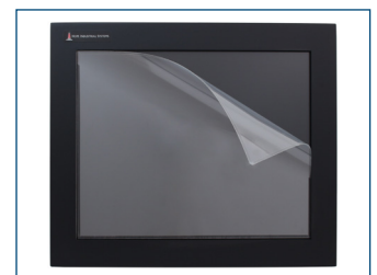
El protector de pantalla opcional protege las pantallas táctiles contra los arañazos y el desgaste.