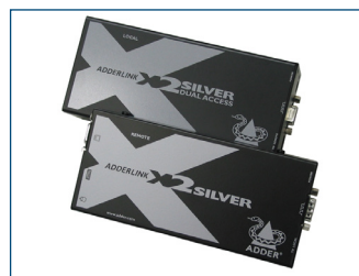
El extensor de KVM opcional permite colocar el monitor a una distancia de hasta 300 m del ordenador.