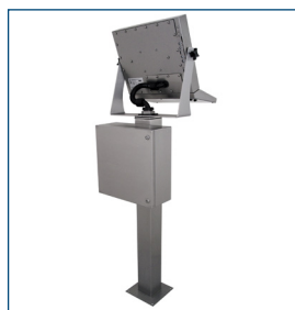
Estación de trabajo con pedestal y carcasa para thin-client.