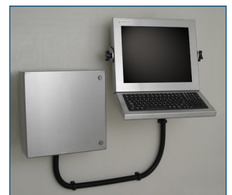
Carcasa para thin-client de montaje en pared estación de trabajo y monitor.