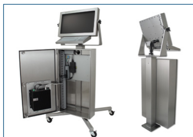
Estación de trabajo con carcasa para PC industrial y ordenador integrado Dell Box PC 5000