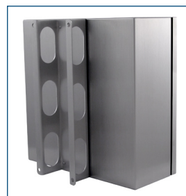
Carcasa para thin-client de Hope Industrial con soporte de montaje en pared opcional.