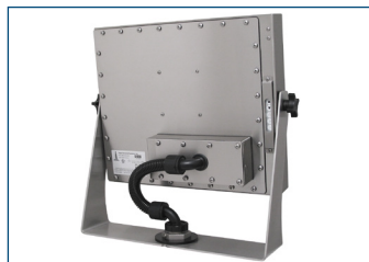
Monitor de montaje universal en montaje de fijación industrial con extensor de KVM.