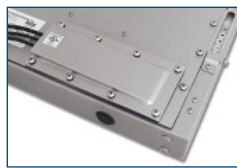
Prensaestopas (IP22 o IP65/IP66)