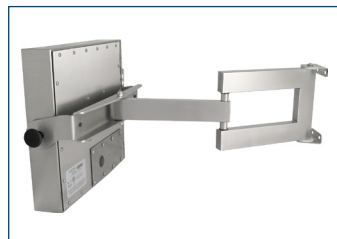
Monitor de montaje universal montado en montaje de brazo para industria pesada con clasificación IP65/IP66.