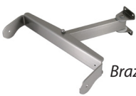
Brazo de articulado simple