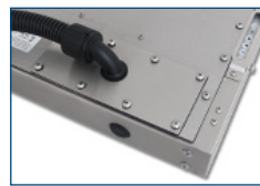
Salida para cables de conducto (IP65/IP66)