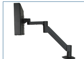
Monitor de montaje universal montado en brazo radial VESA.