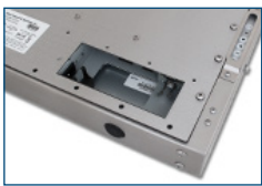
Abertura para conectores internos