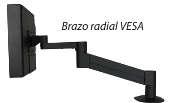
Brazo radial VESA

Los orificios VESA permiten el montaje en una pared, banco, poste o columna