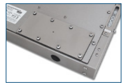
Placa de cubierta de orificio guía (IP65/IP66)