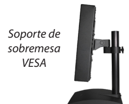
Soporte de sobremesa VESA