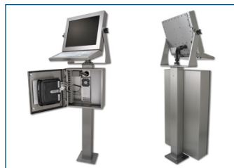
Configuración de estación de trabajo completa con carcasa para PC, teclado, fijación y pedestal.